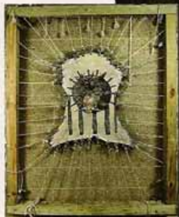
● 数码土王(全部), 数码兽皮印刷, 60"×72", 2004