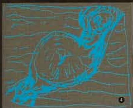
① ② ③ ④ BuriStumpArm+4 树结胳膊 +4 (构思草图)