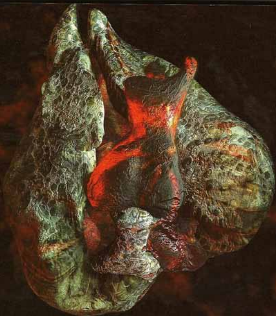
◎ 容州人体3, 数码岩石印制和三维动画, 30"×24", 2006

当 电脑诞生以后, 产生了数码艺术, 无论是在产业应用还是传达观念中, 它都对动画的表现手段进行了扩展。数码科技现在已经融于我们的日常生活中, 很难想像我们突然离开电脑的生活。作为新媒体艺术的一个部分, 数码科技正在成长起来, 成为大多数人都能接受的事物。这不但使艺术在数码领域有了很大的发展空间, 也为纯艺术动画(观念动画)的发展带来了新的希望。行为艺术和装置艺术的发展已经在理论上为艺术家提供了非常广阔的发挥空间, 梦幻般的观念动画也就找到了更新的表达领域。