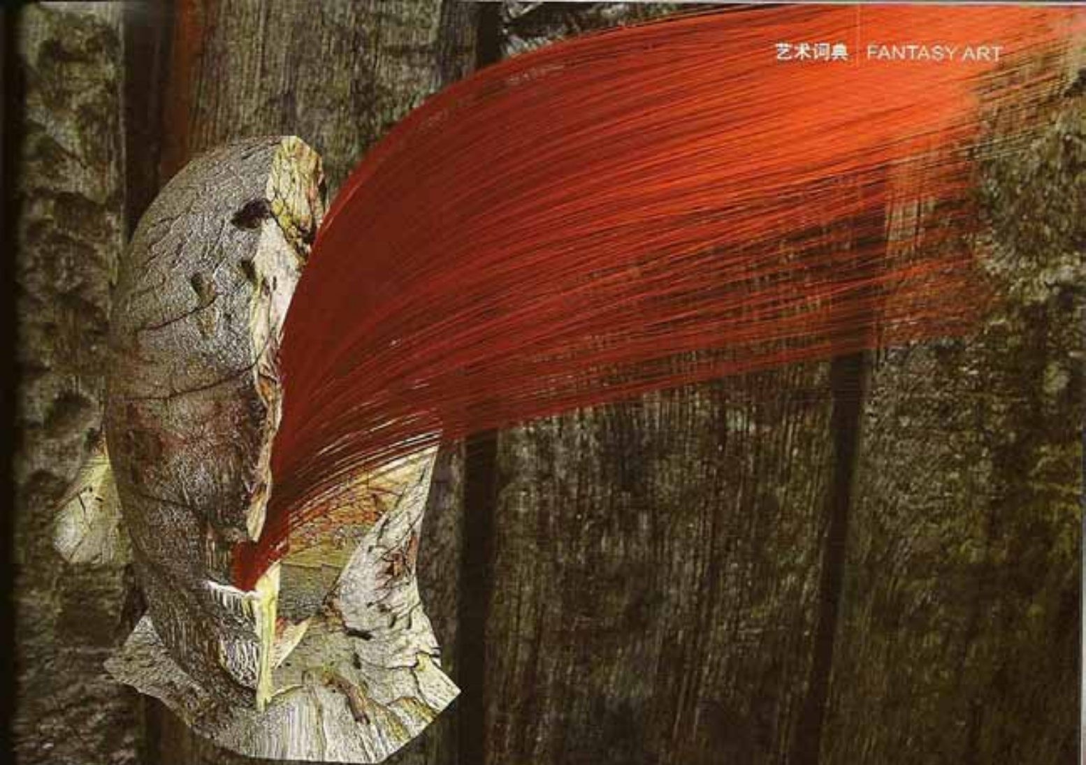
● 树结发红，数码岩石印制与动画，42"×62"，2005