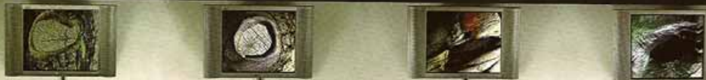
◎ 数码原木印制与动画, 72"×128"×12", 2005

数码原始艺术是谭力勤先生近几年对数码艺术的一种多元多向的主体探索和创新。它建立了一个对等的公式——通过掌握原始兽皮制作工艺, 来创作出现代的数码艺术, 反其道行之, 则是用现有的数码科技去制作更新款的原始艺术。它的探索研究目的简而言之是, 融数码技术和原始观念于一体, 开凿远古精神和